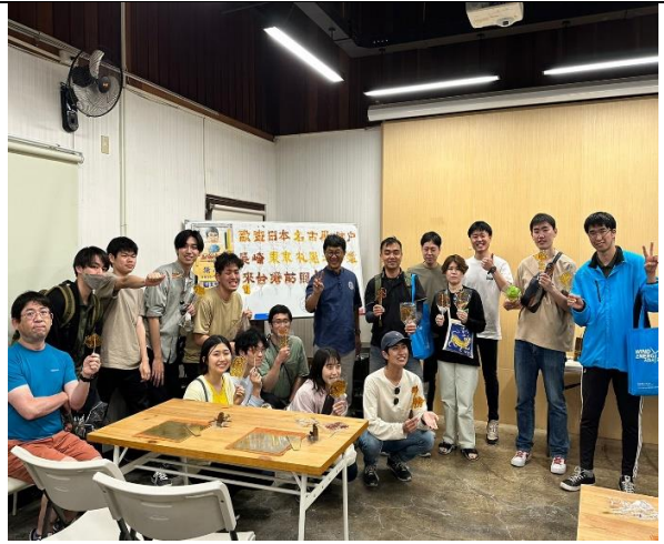
3/12 日蓮池潭在地故事-摸摸得平安