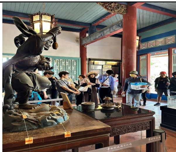
3/11 日文昌閣、海神廟的文史遺跡認識及建物風格的體現